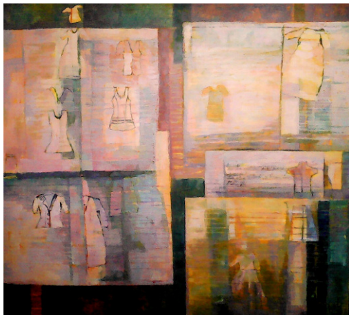
Patricia Orbegosa Páginas / oil / canvas / 0.90 x 100 cm

Blasiikirche geöffnet: Freitag – Mittwoch 11 – 17 Uhr