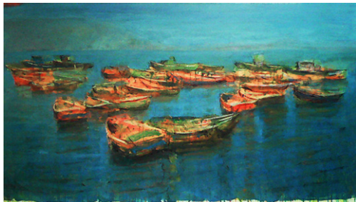
José Gomez Par la Tarde / oil / canvas / 0.85 x 150 cm